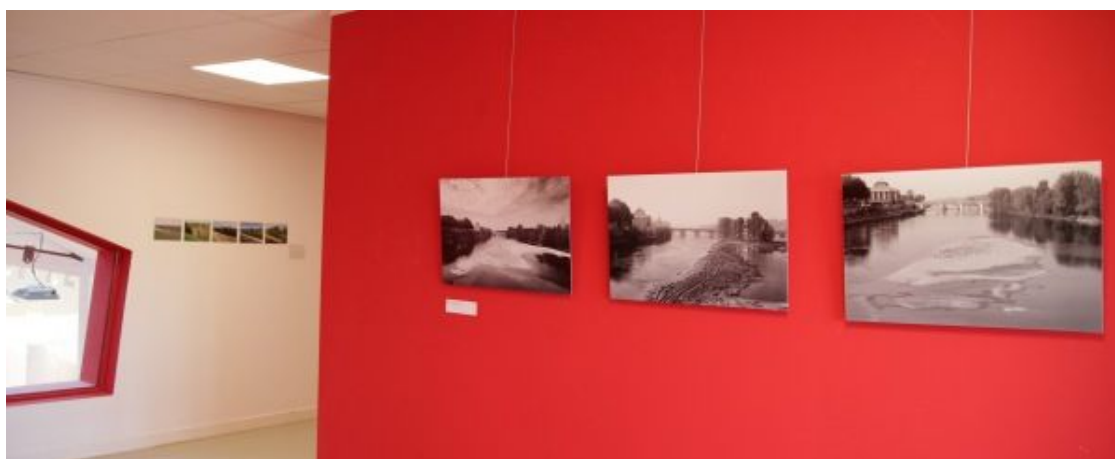
Prises de vues sur l'exposition au musée de la Marine de Loire, Châteauneuf-sur-Loire en 2023 :