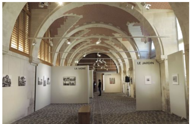
Prises de vues sur l'exposition du Prix Mark Grosset au Centre Charles Peguy à Orléans en 2023