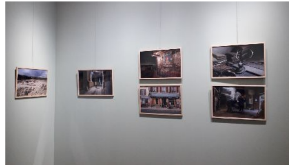
Prises de vues sur l'exposition d'Arina Essipowitsch, Château de Tours en 2023